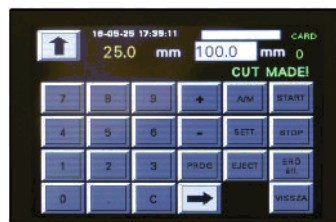
Používateľsky prístupná dotyková obrazovka

Rad elektromechanických rezačiek papiera značky e-cut je najefektívnejšou voľbou pre malé tlačiarne a digitálne štúdiá. Zaručujú úžasný spôsob rezania, vďaka ktorému sme dosiahli takú vysokú rýchlosť ako nikto iný. Počas procesu navrhovania bolo našim cieľom vyrobiť kompaktný stroj so všetkými dôležitými vlastnosťami. Duálny zadný doraz poskytuje dlhotrvajúcu a stabilnú presnosť rezaného materiálu a nožný pedál len podporuje jednoduchosť používania. Vysokokvalitné ochranné bočné fotobunky boli vyvinuté pre maximálnu bezpečnosť operátora. Nastaviteľná prítláčna sila a ľahko programovateľný všestranný softvér pomáhajú každému operátorovi získať čo najviac zo zariadenie prostredníctvom farebnej dotykovej obrazovky.